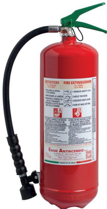
KODE 22062-1E VERSION MIT CLIP