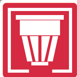
ZONA CON RIVELATORI DI FUMO