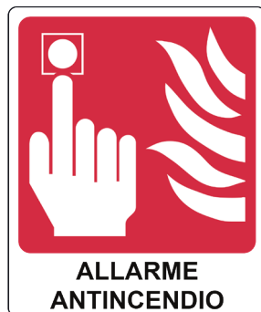
CARTELLI IN ALLUMINIO ALLARME ANTINCENDIO