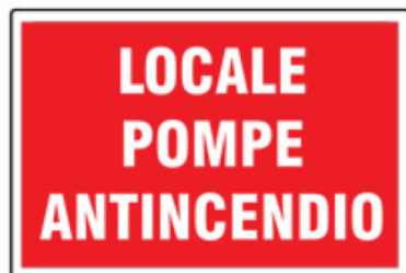
CARTELO IN ALLUMINIO LOCALE POMPE ANTINCENDIO