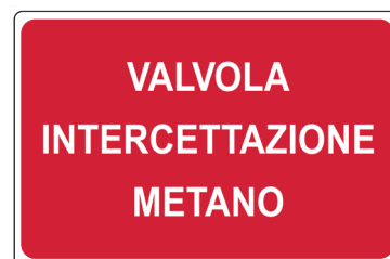
CARTELO IN ALLUMINIO VALVOLA INTERCETTAZIONE METANO