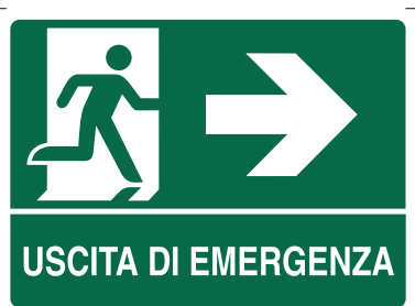
CARTELLO IN ALLUMINIO USCITA DI EMERGENZA FRECCIA A DESTRA