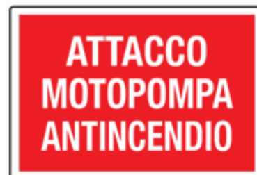
CARTELO IN ALLUMINIO ATTACCO MOTOPOMPA