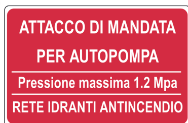
CARTELO IN ALLUMINIO ATTACCO DI MANDATA PER AUTOPOMPA