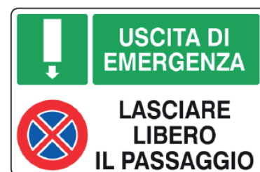
CARTELO IN ALLUMINIO USCITA DI SICUREZZA