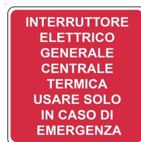
CARTELLI IN ALLUMINIO INTERRUTTORE ELETTRICO GENERALE