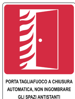
CARTELLI IN ALLUMINIO PORTA TAGLIAFUOCO CON TESTO