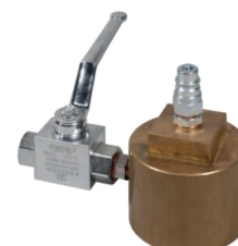
Anschlussstück für die Prüfung von fahrbaren Pulver- und Schaumlöschern 2"