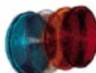
SCHERMI DI SEGNALAZIONI (in dotazione nei modelli IP65)