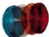
SCHERMI DI SEGNALAZIONI (in dotazione)