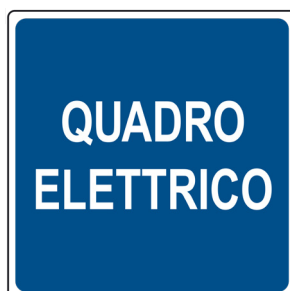
CARTELLO IN ALLUMINIO QUADRO ELETTRICO