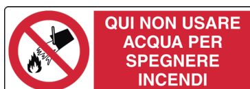
CARTELLO IN ALLUMINIO QUI NON USARE ACQUA PER SPEGNERE INCENDI