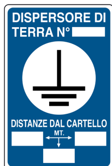
CARTELLO IN ALLUMINIO DISPENSORE DI TERRA N.