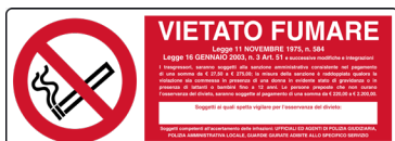
CARTELLO IN ALLUMINIO VIETATO FUMARE CON LEGGE