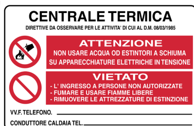
CARTELLO IN ALLUMINIO AVVERTENZE CENTRALE TERMICA