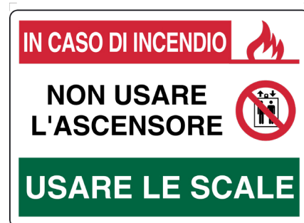
CARTELLO IN ALLUMINIO IN CASO DI INCENDIO NON USARE L'ASCENSORE