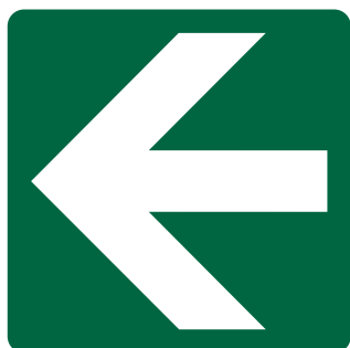
CARTELLO IN ALLUMINIO DIREZIONE DA SEGUIRE