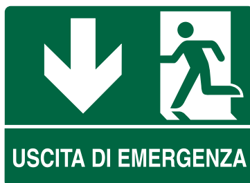
CARTELLO IN ALLUMINIO USCITA DI EMERGENZA FRECCIA BASSO