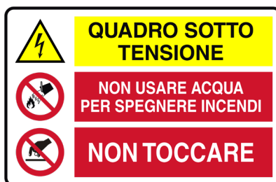
CARTELLO IN ALLUMINIO MULTISIMBOL O