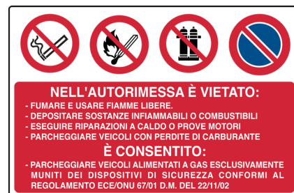
CARTELLO IN ALLUMINIO PER AUTORIMESSA