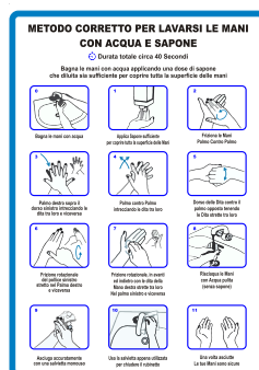
CARTELLO IN ALLUMINIO METODO CORRETTO PER LAVARSI LE MANI