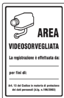
CARTELLO IN ALLUMINIO AREA VIDEO- SORVEGLIATA