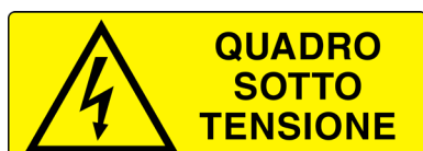
CARTELLO IN ALLUMINIO QUADRO SOTTO TENSIONE