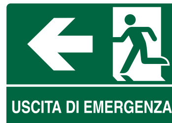
CARTELLO IN ALLUMINIO USCITA DI EMERGENZA FRECCIA A SINISTRA