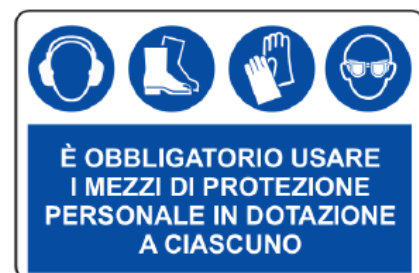
CARTELLO IN ALLUMINIO OBBLIGO DPI