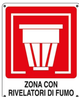
CARTELLO IN ALLUMINIO ZONA CON RILEVATORI DI FUMO