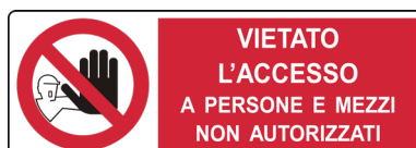
CARTELLO IN ALLUMINIO VIETATO L'ACCESSO A PERSONE E MEZZI NON AUTORIZZATI