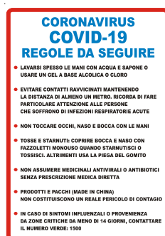
CARTELLO IN ALLUMINIO RE GOLE COVID 19