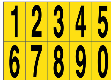
ADESIVO NUMERATO DA 0 A 9 - 40 PEZZI PER FOGLIO