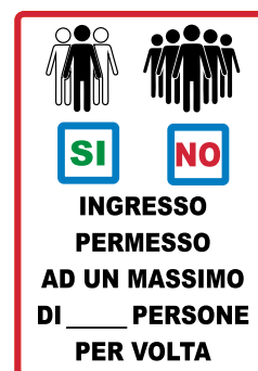
CARTELLO IN ALLUMINIO INGRESSO PERMESSO