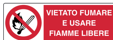
CARTELLO IN ALLUMINIO VIETATO FUMARE E USARE FIAMME LIBERE