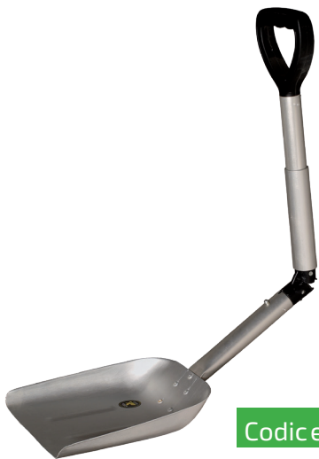
BADILE PIEGHEVOLE ANTISCINTILLA