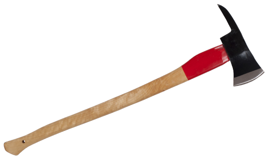
ASCIA DA SFONDAMENTO