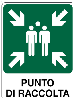
CARTELO IN ALLUMINIO PUNTO DI RACCOLTA CON TESTO