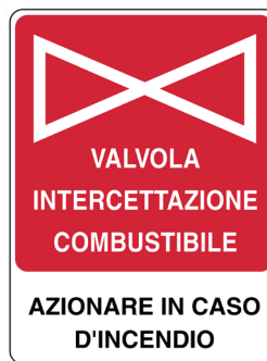
CARTELO IN ALLUMINIO VALVOLA INTERCETTAZIONE COMBUSTIBILE