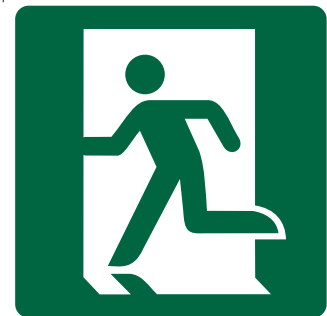
CARTELO USCITA DI EMERGENZA A SINISTRA