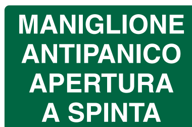
CARTELO IN ALLUMINIO MANIGLIONE ANTIPANICO