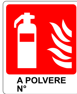
CARTELO IN ALLUMINIO ESTINTORE A POLVERE CON TESTO "ESTINTORE N°"