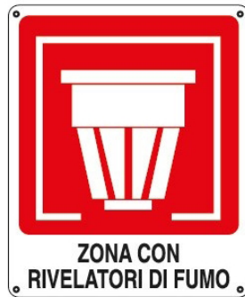
CARTELO IN ALLUMINIO ZONA CON RILEVATORI DI FUMO