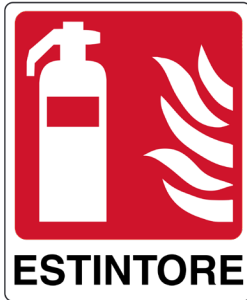
CARTELO IN ALLUMINIO ESTINTORE CON TESTO