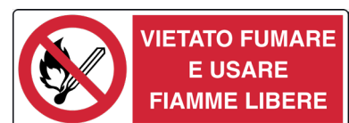
CARTELO IN ALLUMINIO VIETATO FUMARE E USARE FIAMME LIBERE