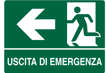
CARTELO IN ALLUMINIO USCITA DI EMERGENZA FRECCIA A SINISTRA