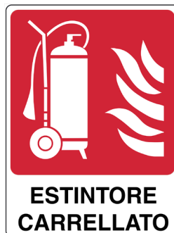
CARTELO IN ALLUMINIO ESTINTORE CARRELLATO CON TESTO