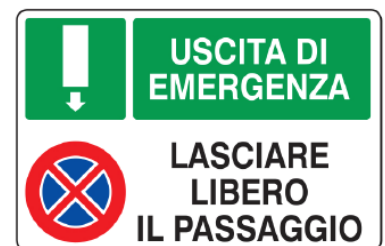
CARTELO IN ALLUMINIO USCITA DI SICUREZZA