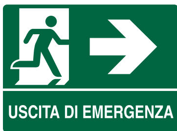
CARTELO IN ALLUMINIO USCITA DI EMERGENZA FRECCIA A DESTRA