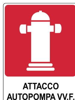
CARTELO IN ALLUMINIO ATTACCO AUTOPOMPA VFF CON TESTO