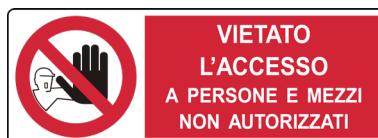
CARTELO IN ALLUMINIO VIETATO L'ACCESSO A PERSONE E MEZZI NON AUTORIZZATI