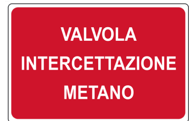
CARTELO IN ALLUMINIO VALVOLA INTERCETTAZIONE METANO