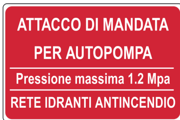
CARTELO IN ALLUMINIO ATTACCO DI MANDATA PER AUTOPOMPA