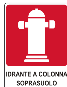
CARTELO IN ALLUMINIO IDRANTE A COLONNA SOPRASUOLO CON TESTO