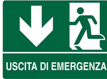
CARTELO IN ALLUMINIO USCITA DI EMERGENZA FRECCIA BASSO