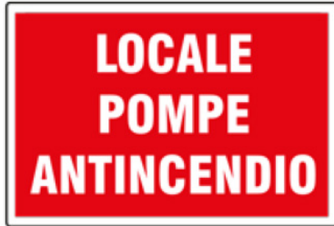
CARTELO IN ALLUMINIO LOCALE POMPE ANTINCENDIO