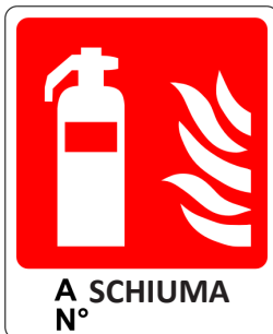
CARTELO IN ALLUMINIO ESTINTORE A SCHIUMA CON TESTO "ESTINTORE N°"