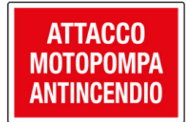
CARTELO IN ALLUMINIO ATTACCO MOTOPOMPA