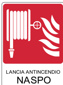
CARTELO IN ALLUMINIO LANCIA ANTINCENDIO NASPO CON TESTO