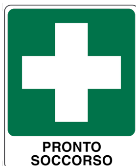
CARTELO IN ALLUMINIO PRONTO SOCCORSO CON TESTO