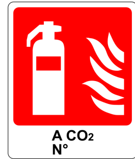
CARTELO IN ALLUMINIO ESTINTORE A CO2 CON TESTO "ESTINTORE N°"