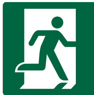
CARTELO USCITA DI EMERGENZA A DESTRA