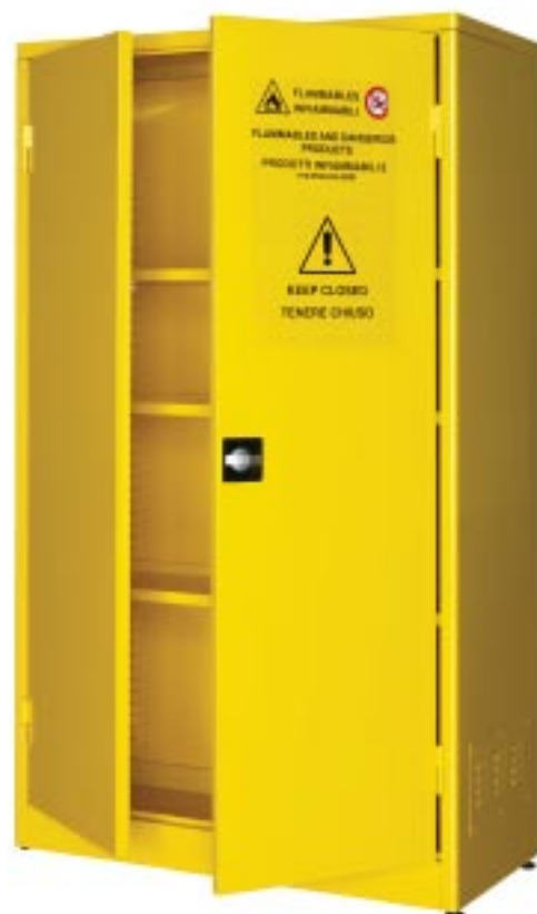
Armadio per liquidi infiammabili (2 ante/3 ripiani) Dim. mm 1075x500x1850h