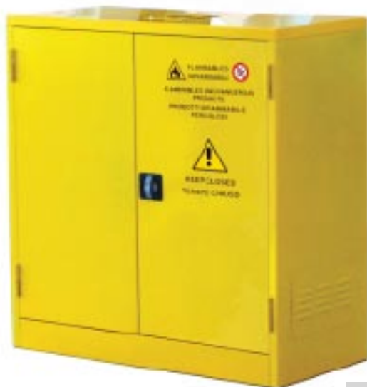
Armadio per liquidi infiammabili (2 ante/2 ripiani) Dim. mm 1075x500x1100h

Per altre dimensioni, contattare ns. sede