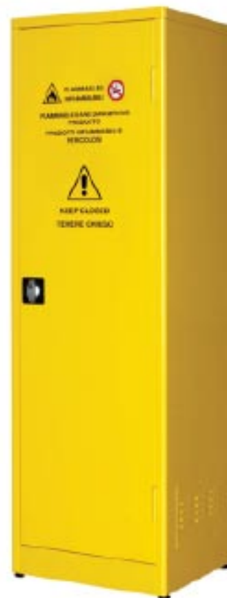
Armadio per liquidi infiammabili (1 ante/3 ripiani) Dim. mm 575x500x1850h