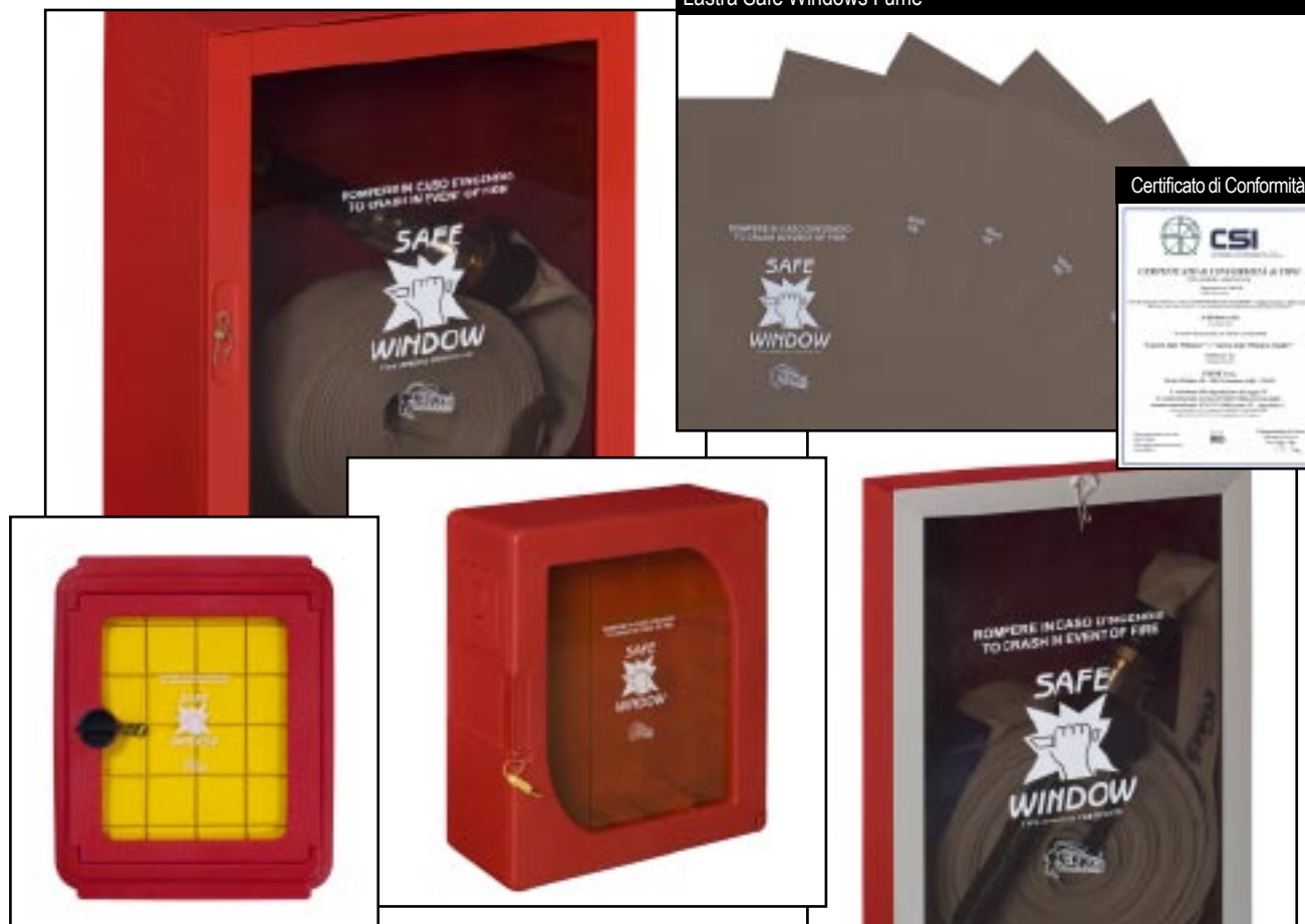
Lastra Safe Windows Fumè