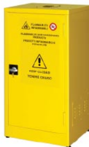
Armadio per liquidi infiammabili (1 ante/2 ripiani) Dim. mm 575x500x1100h