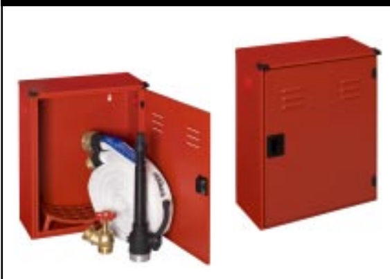
Idrante a muro da esterno rosso Dim. mm 400x180x510h