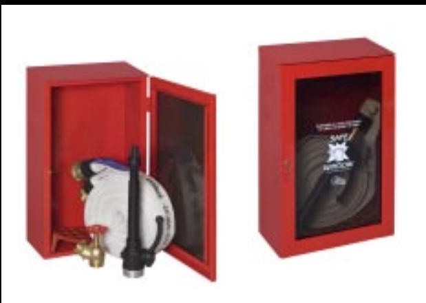
Idrante a muro da esterno Dim. mm 370x210x610h