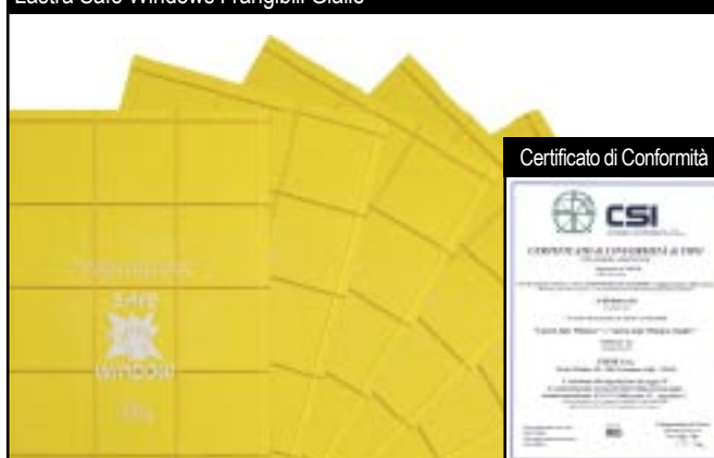
Lastre Safe Windows Frangibili Gialle

SI POSSONO REALIZZARE LASTRE DI QUALSIASI MISURA PRETAGLIANDO LE DIMENSIONI PIÙ GRANDI O REALIZZANDO LE SU RICHIESTA.